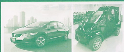
HONDA 燃料電池自動車 FCXクラリティ